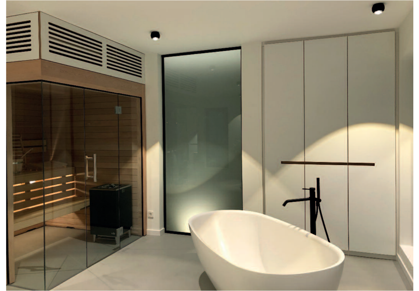
déploient toute leur envergure à l'arrière avec des façades copieusement vitrées et orientées vers le paysage naturel.