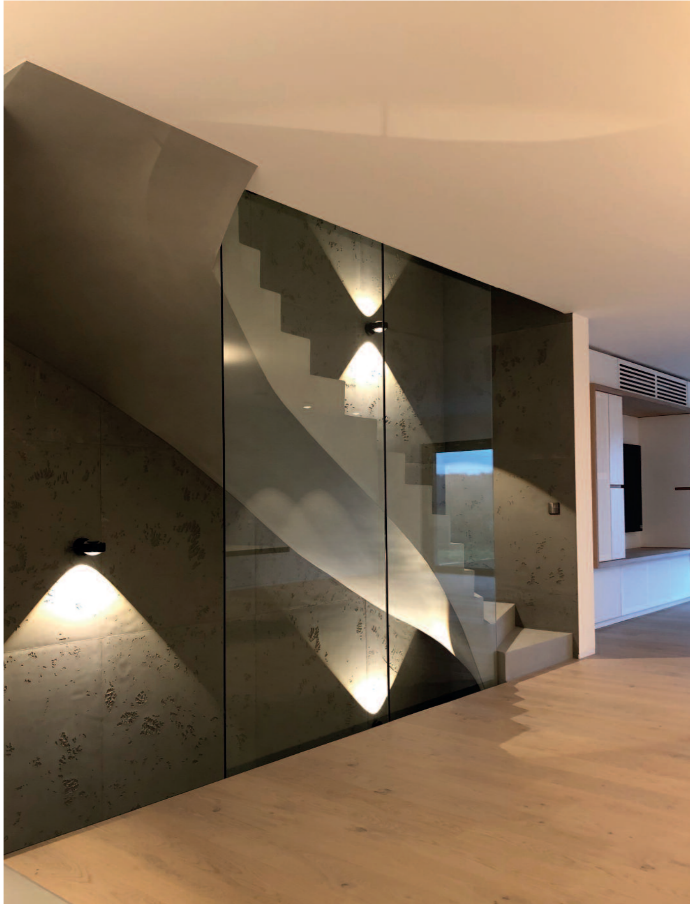
L'architecte souligne la mise en scène par des systèmes domotiques et d'éclairage d'ambiance très sophistiqués. Les maisons